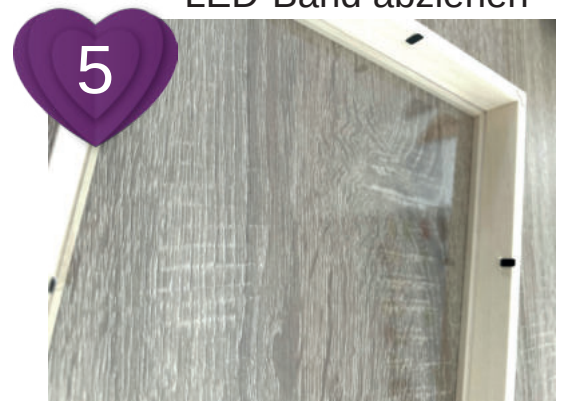
5 Plexiglasscheibe unten in den Rahmen legen