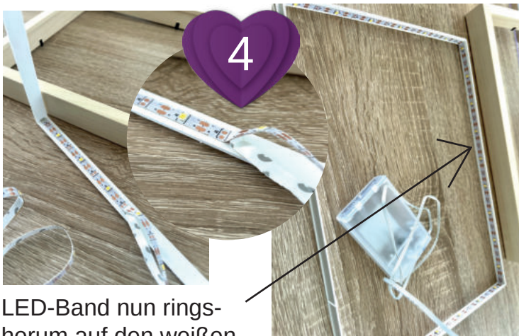
4 LED-Band nun rings- herum auf den weißen Abstandshalter kleben