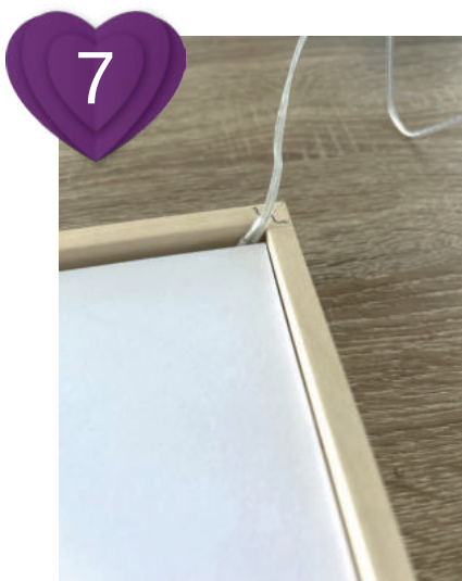
7 Bild/Bastelmotiv einlegen und Kabel vom LED-Band rauslegen