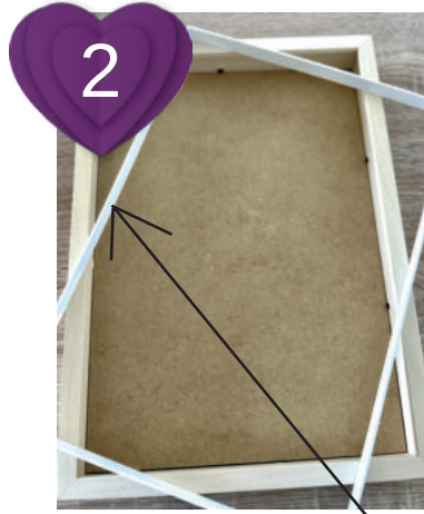
2 Rahmen öffnen, Abstands- halter herausnehmen