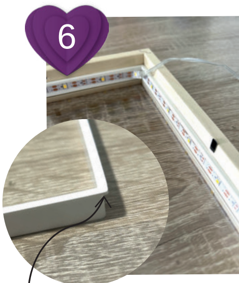
6 Abstandsh. inkl. LED mit der Kante nach oben in den Rahmen legen und Kabel heraushängen lassen