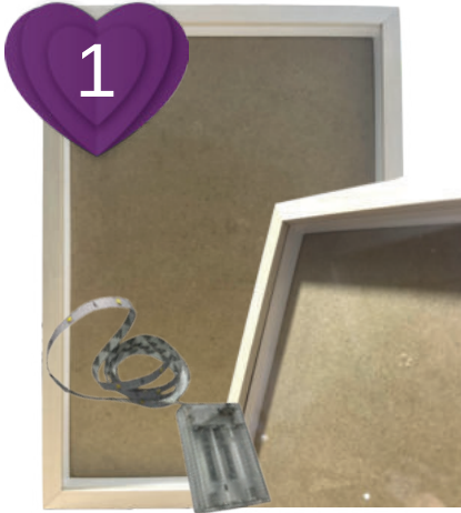
1 Material bereitlegen