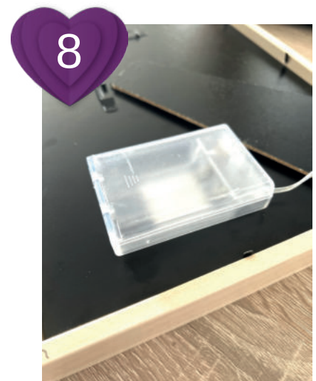
8 Zum Schluss Rückwand auflegen, verschließen und Batteriefach mit doppelseitig. Klebeband etc. befestigen